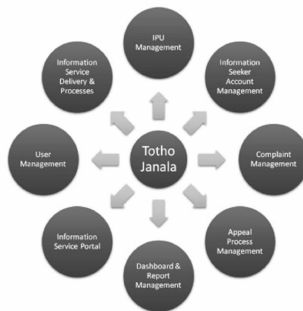
Figure 1: Components of Totho Janala